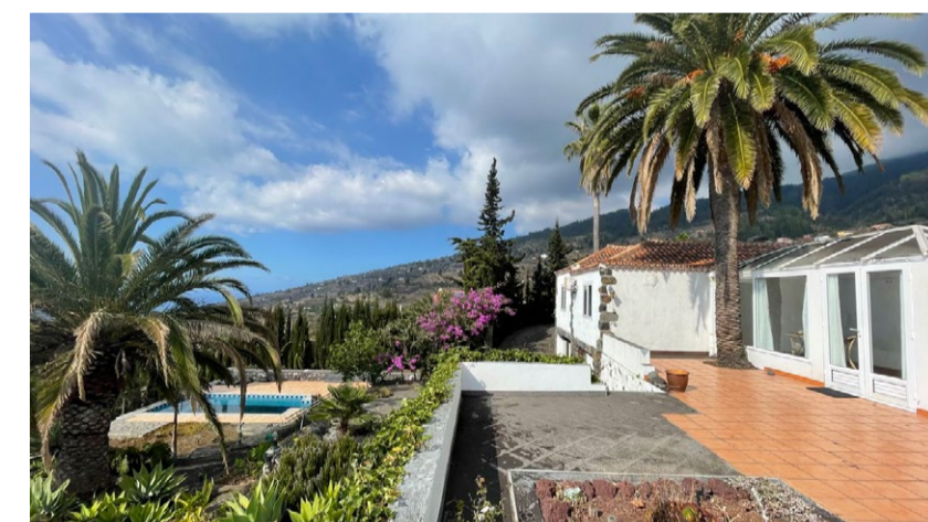
TIJARAFE 510.000 €

Renovierungsobjekt: 2 große Steinhäuser mit großem Grundstück. Para reformar: Dos casas canarias antiguas con terreno grande.