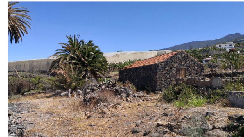
LA PUNTA 250.000 €

Sehr gepflegtes Reihenhaus mit Garage in Stadtnähe. Adosado bien cuidado con garaje cerca del centro.