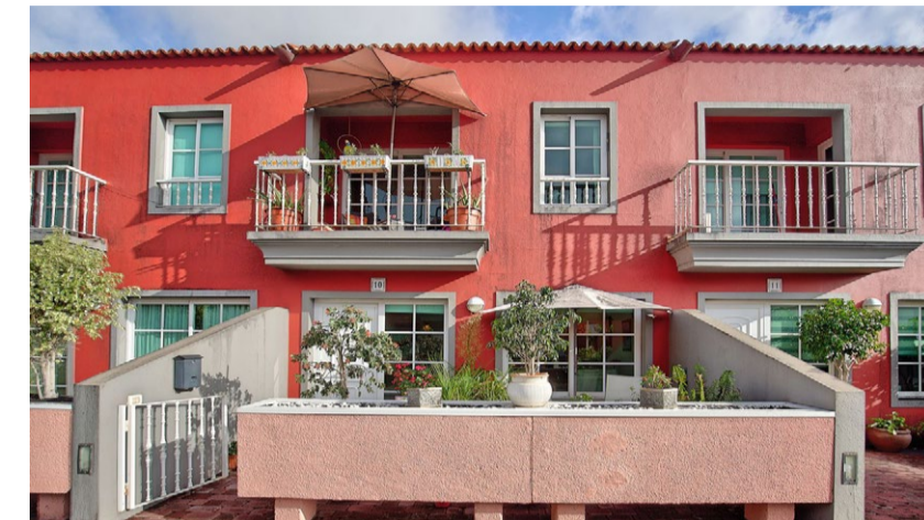
LOS LLANOS - TRIANA 269.000 €

Sehr gepflegtes Reihenhaus mit Garage in Stadtnähe. Adosado bien cuidado con garaje cerca del centro.